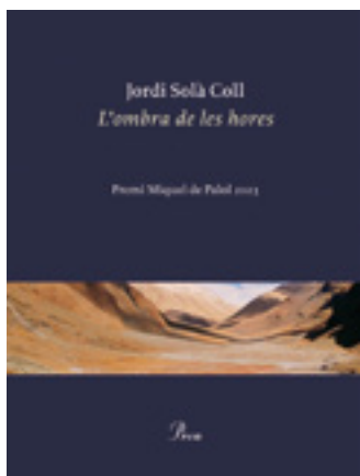
L'ombra de les hores Edicions Proa Jordi Solà Coll 80 pàgines PVP 15,50 €