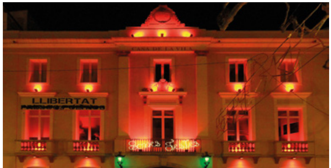
Façana de l'Ajuntament per les passades festes nadalenes

El que ha estat el darrer ple ordinari del 2021 es va fer en format híbrid. És a dir, ha combinat la presència de l'alcalde i els portaveus dels grups municipals a la Sala de Plens amb la connexió telemàtica de la resta de regidors i regidores quan havien d'intervenir en algun dels punts. Precisament es va poder implementar aquesta nova manera de celebrar les sessions, en seguiment de les mesures de contenció preventiva per a l'expansió de la COVID, gràcies a la instal·lació de diverses millores tecnològiques que s'han posat en marxa les darreres setmanes en aquest equipament municipal. ■