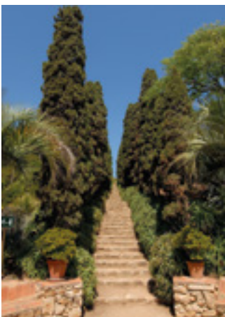
Jardí Botànic Marimurtra

Els efectes de la pandèmia es continuen notant al Jardí Botànic Marimurtra, un dels equipaments turístics més visitants de Blanes i de la Costa Brava. El 2021 es tanca amb una xifra total de 70.807 visitants que representa el 51.82% dels que es van rebre el 2019.