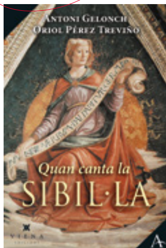
Antoni Gelonch-Viladegut Oriol Pérez Treviño Viena Edicions PVP 19€ 168 pàgines