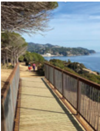
Nou tram del camí de ronda

S'hi han instal·lat elements de seguretat, com passeres i tanques, i també s'han obert un parell de miradors espectaculars