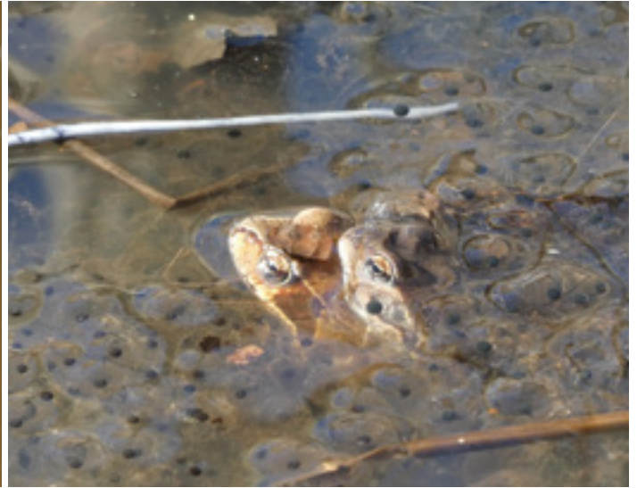
Reineta ( Hyla meridionalis ), una de les espècies que tolera menys la salinització dels aqüífers.

Amplexus i postes de granota roja ( Rana temporaria ) a Sta. Fe del Montseny.