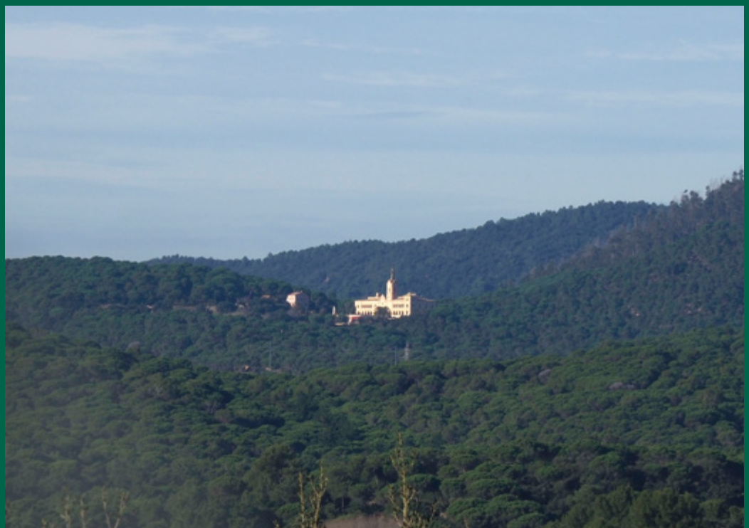
Sant Pere del Bosc Lloret

També preveuen un augment mitjà del 62% del nombre d'incendis, les zones cremades i els riscos forestals relacionats amb el clima. Els indicadors utilitzats per extraure aquest percentatge són molt diversos i inclouen el Fire Weather Index (índex meteorològic de risc d'incendi), el número d'hectàrees cremades, el número de dies amb risc elevat de foc, el número de jornades amb sequeres prolongades i altres riscos relacionats amb el clima, entre molts d'altres.