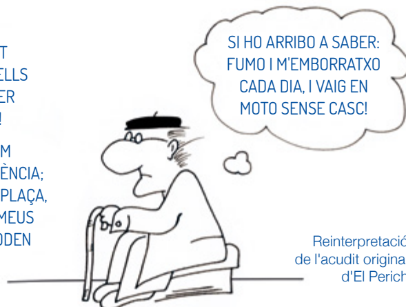
Reinterpretació de l'acudit original d'El Perich

I ARA: LA PENSÍO NO EM PERMET PAGAR UNA RESIDÈNCIA; A LES PÚBLIQUES NO HI HA PLAÇA, NO PUC VIURE SOL, I ELS MEUS FILLS, A L'ATUR, NO EM PODEN AJUDAR!