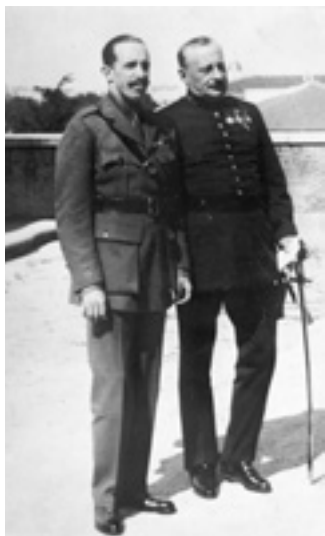
El Rei Alfonso XIII amb el general Miguel Primo de Ribera

«Fa 90 anys queia el règim borbònic i es proclamava la República catalana a Barcelona i l'espanyola a Madrid»