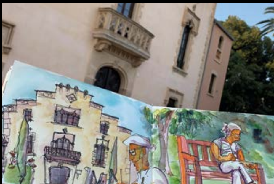
4. USK davant de Can Saragossa, Lloret de Mar.

En aquesta línia treballa des de la vesant pedagògica amb els seus alumnes de batxillerat artístic animant-los a desprendre's dels prejudicis i l'encotillament que la història de les idees estètiques més tradicionals els té acostumats. Enguany ho posaran en pràctica a Berlín on es trobaran amb altres joves vinculats a l'USK en una trobada organitzada per l'Institut Maragall de Barcelona. Aquestes accions fomenten l'intercanvi d'estils, de maneres de fer, la voluntat de millorar dins de l'estil propi de cada dibuixant. Observant el grup s'aprèn de manera sorprenent.