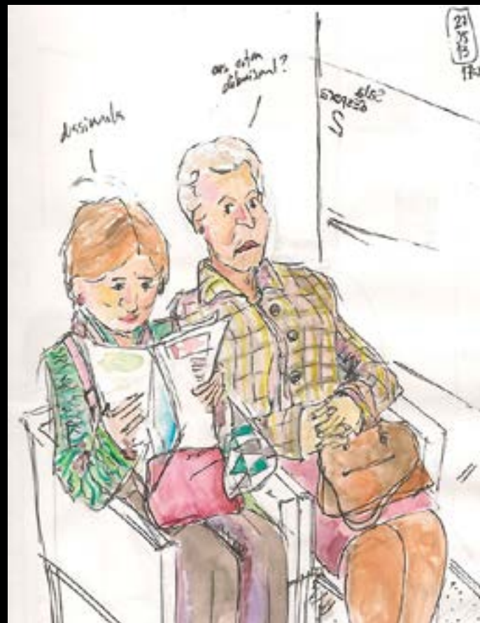
213. Sèrie Waiting rooms , 2013

saven els estius en una finca que encara conserva la família, hi segueix venint sempre. La podem trobar dibuixant en un dia assolellat a Canyelles, un dels seus racons predilectes. Li agraden les festes majors i esdeveniments en directe on cerca la inspiració per les seves obres. Ha participat en diversos simposis i conferències a l'entorn de la filosofia USK ( urban sketcher ).