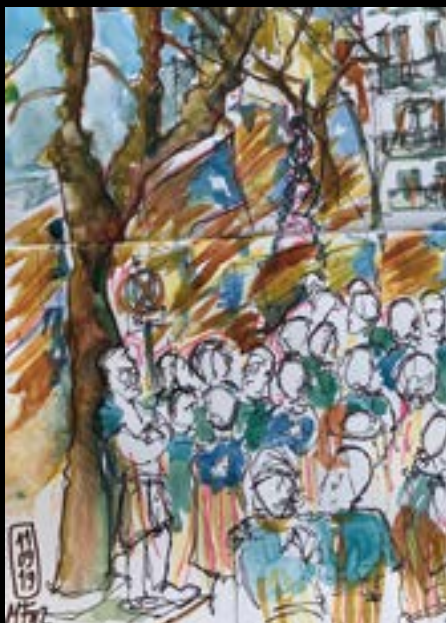
5. Manifestació de l'11 de setembre de 2019 a Barcelona. 6. Montserrat Fando dibuixant a Tossa de Mar