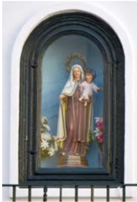
3. Mare de Déu del Carme. Plaça del Carme, 3. Fornícula original: 1892. Imatge de la marededéu: ca. 1950.