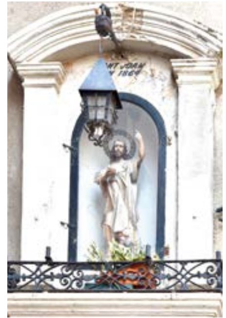
4. Sant Joan Baptista. Fornícula original: 1864. Imatge del sant: ca. 1950.

esperaven amb delit poder embarcar damunt dels cotxes de línia i camions que aquell dia anaven plens de gom a gom.