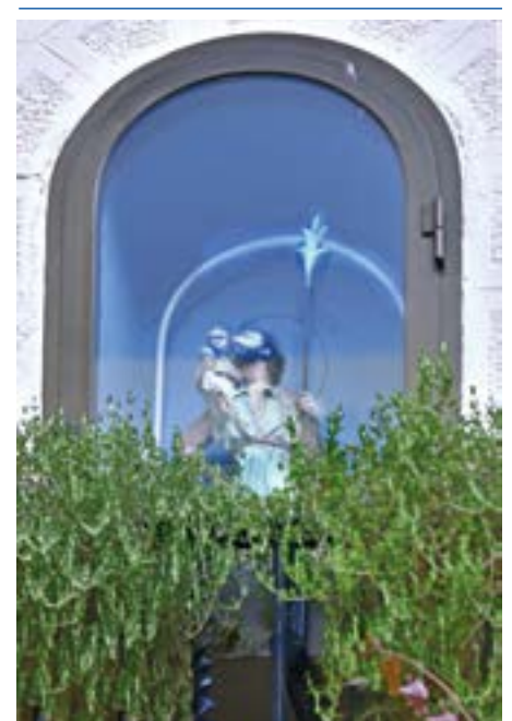
1. Sant Cristòfol. Fornícula original: 1885. Imatge del sant: ca. 1950

Cap al 1950 la festivitat de Sant Cristòfol ja s'havia convertit en una diada consolidada. Se celebrava un ofici solemne a l'església parroquial, i en acabar, es procedia a la benedicció de cotxes, motos i bicicletes. La plaça i els cotxes s'engalanaven per l'ocasió amb garlandes de flors i banderetes. Tancaven la festa una audició de sardanes i algun ball de nit amb la vinguda d'alguna de les orquestres destacades del moment. Els més menuts