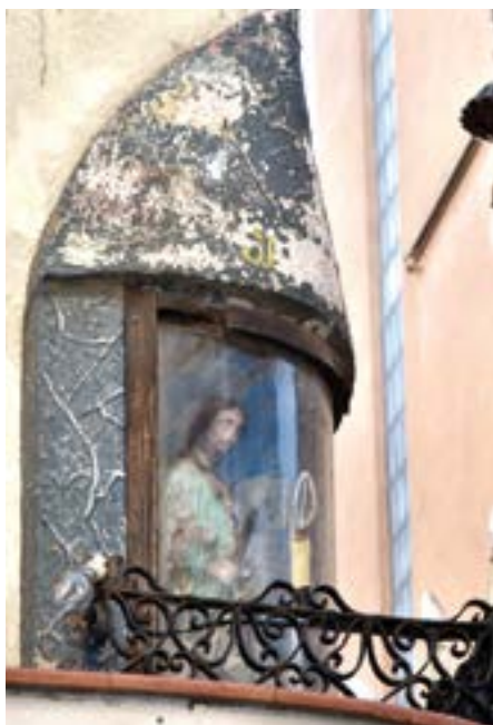
5. Sant Joan Baptista. Fornícula i imatge original: data desconeguda, probablement ca. 1930.

La fornícula més nova, probablement dels anys trenta, va ser col·locada arran d'una baralla entre veïns. El propietari de la capella vella s'havia ofès amb la resta d'organitzadors de la festa i, com a venjança, va treure el sant de la fornícula guardant-lo a dins de casa seva. En resposta d'aquests fets el veïnat va sufragar la construcció d'una nova capella just a la finca del davant per tal de poder celebrar la festa sense problemes. Malgrat semblar no tenir solució les disputes es van solucionar i el sant antic va tornar a lluir a la seva capella.