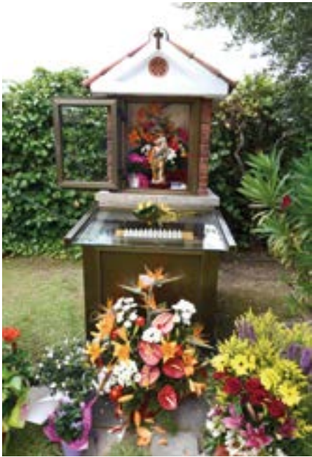
2. Sant Cristòfol. Parc de Sant Cristòfol, Can Ballell. Fornícula i imatge del sant: 1995.