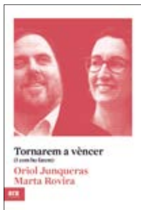
Oriol Junqueras i Marta Rovira Ara llibres 98 pàg.