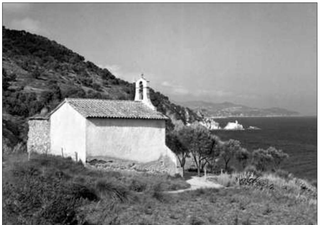
Sant Francesc, Blanes. J.M. JULIÀ, AMBL.