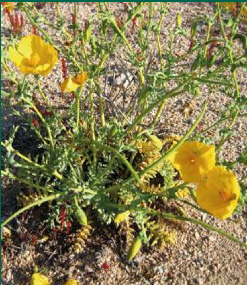
3. Exemplar florit de cascall marí ( Glacium flavum )

vital. En són alguns exemples: el corriol camanegre ( Charadrius alexandrinus ), un ocell limícola necessitat d'aquests ambients per fer-hi el niu —directament a la sorra— que ha patit, a les últimes dècades, una forta regressió; la tortuga babaua ( Caretta caretta ), un rèptil marí que fa la posta als sorrals costaners; el coleòpter Scarabaeus semipunctatus , un tipus d'escarabat piloter, exclusiu dels sorrals litorals, amb una disminució de les seves poblacions i àrees de distribució en els últims 50 anys quedant, tan sols, petites poblacions isolades extremadament vulnerables; etc.