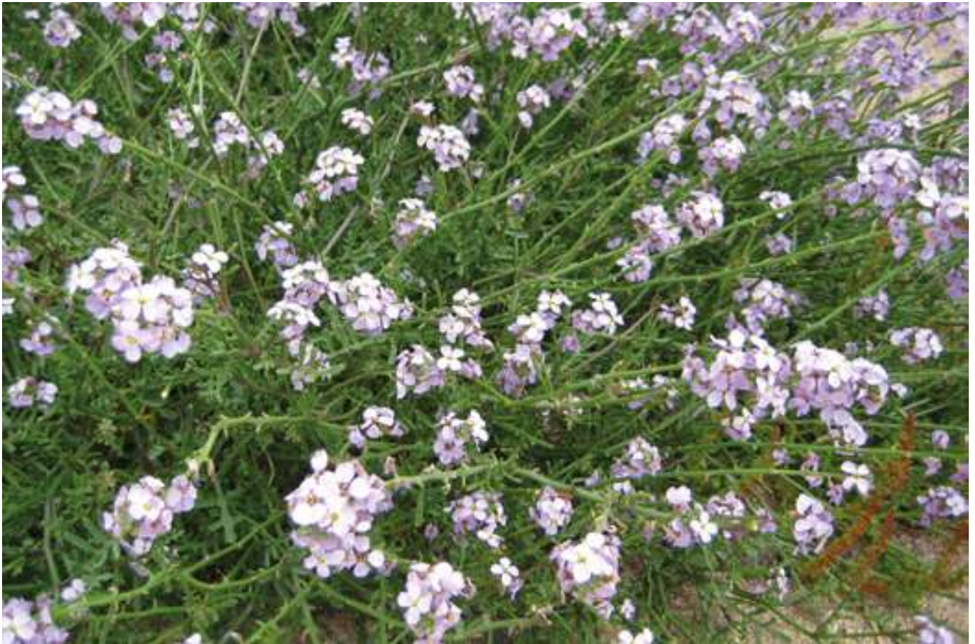
1. Mata florida de rave de mar ( Cakile maritima )

Ara bé, si el panorama vegetal es troba molt malmès, l'animal no es troba en millors condicions, en especial aquelles espècies estrictament o molt relacionades amb els ambients psammòfils litorals, si més no en algun període del seu cycle vital.