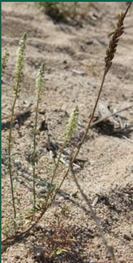
2. Capironat marí ( Reseda hookeri ), florit.