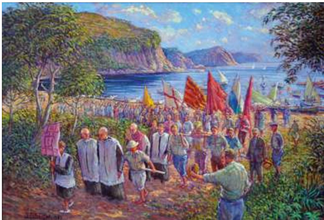
La processó pujant a l'ermita de Santa Cristina, 1991. Oli sobre tela de Joan Sala Lloberas

presentació i ornamentació de l'ermita i, a la tarda, ballaran el Ball de Plaça. Un cop arran d'aigua, la comitiva puja a les barques que hi ha preparades. La que embarca Santa Cristina –les altres imatges queden a terra esperant el retorn– rep el nom de “barca capitana”. També, des de 1987, que es van recuperar, hi ha preparats els llaguts que ara, tripulats per jovent d'ambdós sexes, fan presents els diversos clubs esportius de rem, però que abans, tripulats per pescadors, representaven els diversos gremis implicats a la festa. Hi ha moltes embarcacions d'esbarjo que s'afegeixen a la festa. Totes plegades inicien un seguici nombrós i de molta vistositat, darrera la barca capitana, cap a la platja de Santa Cristina però que, primer, dona una volta per la badia lloretenca fins posar proa cap a garbí. Quan la processó marítima és davant la platja de Fenals i s'albira, en la llunyania, el santuari de Sant Pere del Bosc, la comitiva s'atura i es canta una Salve, mentre les barques alcen els remes en una de les estampes més emotives del dia. Tot seguit, les embarcacions de la processó van avançant al seu ritme cap a Santa Cristina, però els llaguts tripulats per nois prenen un pro-