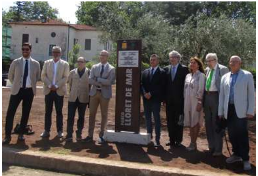
1. Part de la delegació lloretenca i autoritats d'ambdues poblacions al costat del monòlit que dona el nom de Lloret al parc

Amb motiu dels quinze anys de l'agermanament, els bolsenesos han volgut correspondre dedicant a Lloret un parc en una zona d'expansió de la seva ciutat.